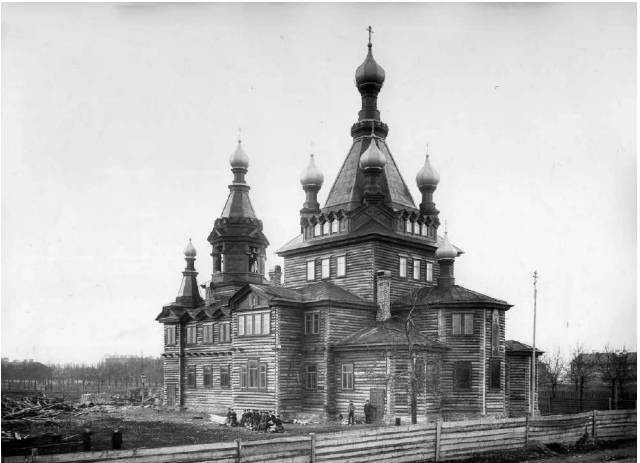
Иоанно-Предтеченская церковь 1898-1899 годы