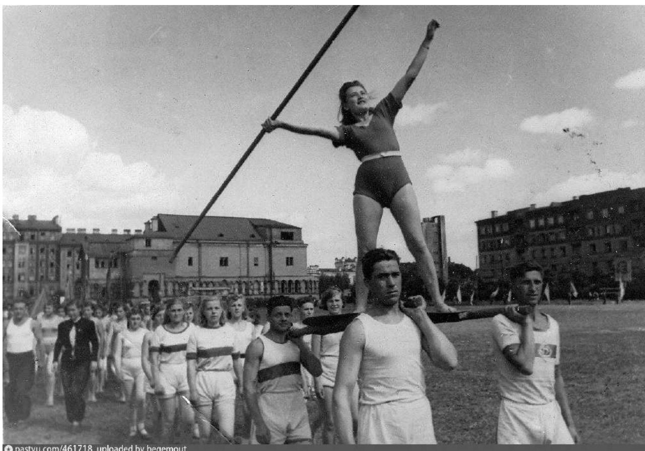
Архивное фото: спортивный праздник на стадионе Красная Заря, 1944 год

Вскоре храм был закрыт и вместе с прилегающей к нему территорией передан телефонному заводу «Красная Заря», бывшему заводу «Эриксон». Церковь