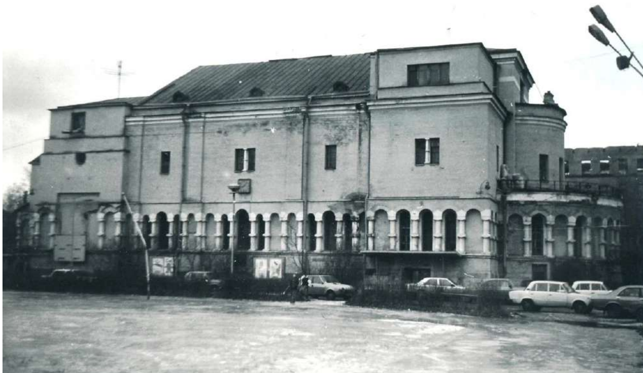
Архивное фото: перестроенный храм, 1995 год.