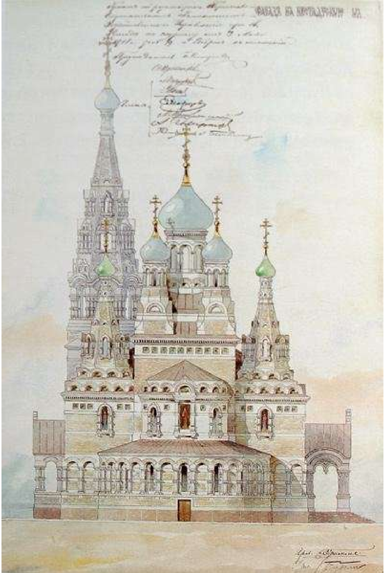
Проектный чертеж храма Иоанна Предтечи

А архитекторы Густав фон Голи и Герман Гримм сразу начали проектировать новый храм Иоанна Предтечи — теперь каменный и в два раза больше прежнего. В